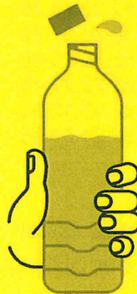
JE BOIS RÉGULIÈREMENT DE L'EAU

En période de canicule, quels sont les bons gestes?